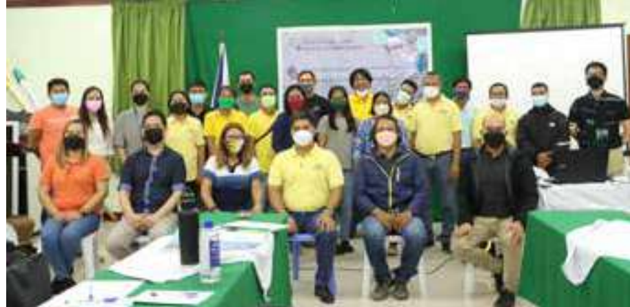
Aktibong lumahok ang DA-PCC sa Rehiyon 11 at 12 sa isinagawang situation analysis para sa pagpapatupad ng Carabao-based Business Improvement Network (CBIN) at Coconut-Carabao Development Project (CCDP).